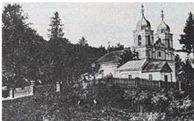
Костёл Петра и Павла

В 1768 году костел был закрыт и служба перенесена на польское кладбище в деревянный костел Святого Петра и Павла.