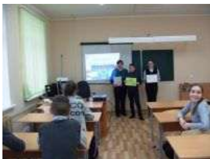
МБУК «Велижская ЦБС»